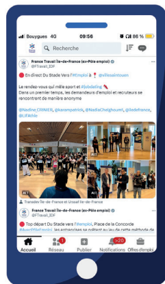
Post de France Travail Île-de-France