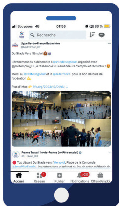
Post de la Ligue d'Île-de-France de Badminton